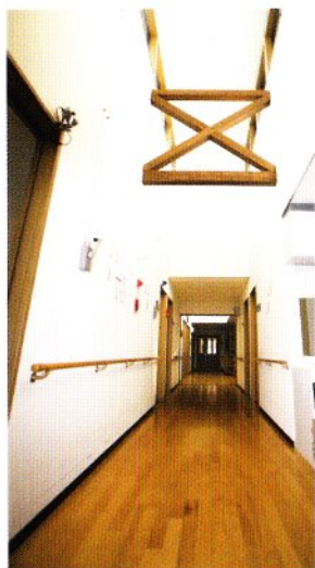
■日差しが差し込む廊下

ご利用者のやすらぎとゆとりを第一に考えた生活環境は、きっと毎日の暮らしに安心と笑顔があふれます。